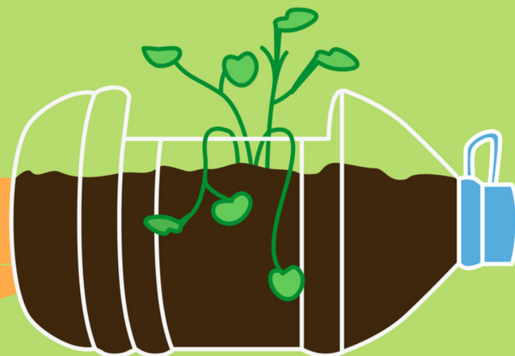
bidones de agua