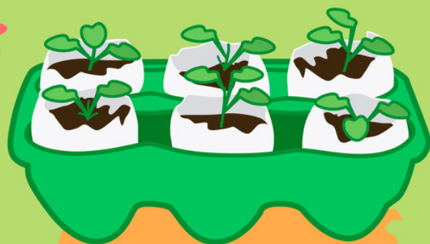
cajas de huevo