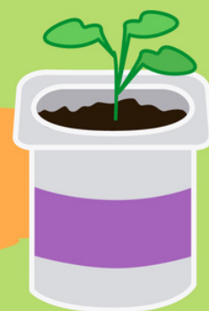
envases de yogurt